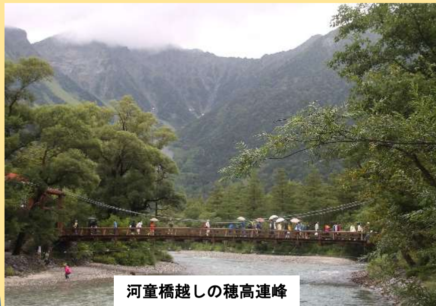
河童橋越しの穂高連峰