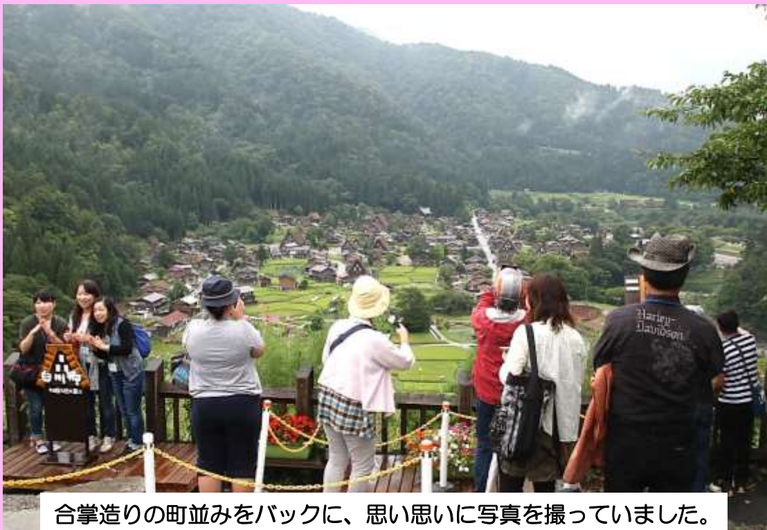
合掌造りの町並みをバックに、思い思いに写真を撮っていました。