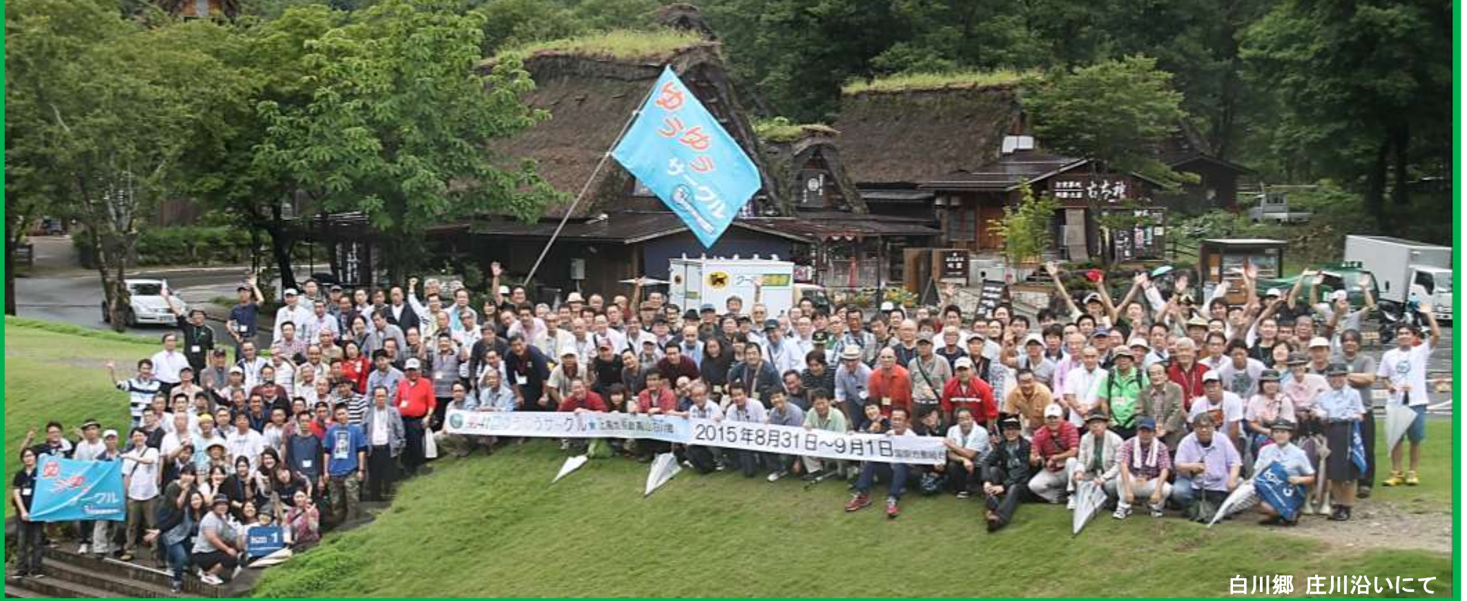
白川郷 庄川沿いにて