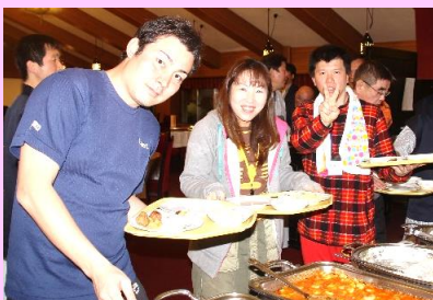
美味しくいただきました～