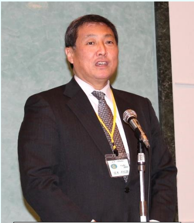
茨木中央執行委員長