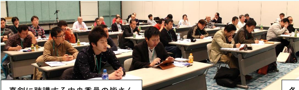
真剣に聴講する中央委員の皆さん